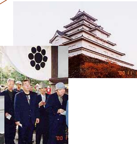
7月 B班旅行 浅虫温泉の旅 (写真右)