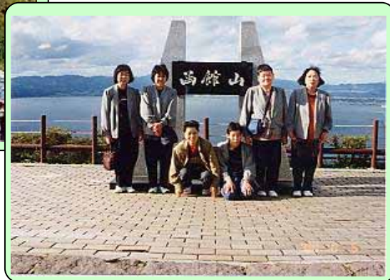
9月 レク・ドライブ 函館山