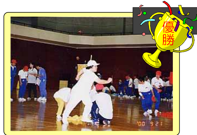
9月 三施設合同大運動会