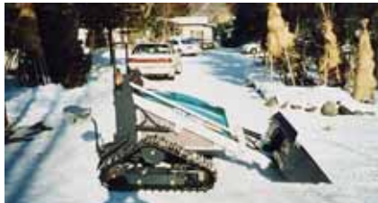
除雪機 (写真左上より正面、背面、側面)

函館市の平成11年度社会福祉施設整備費補助金の交付を受けて、下記の事業を完了致しました。