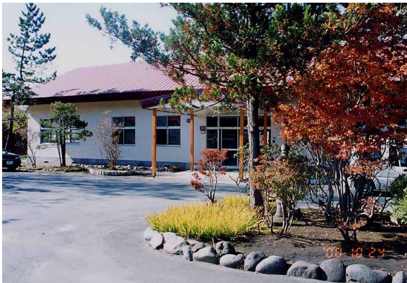
秋景／函館共働宿泊所救護部正面玄関にて