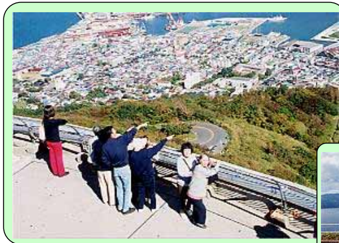
函館山展望台より函館市街を望む