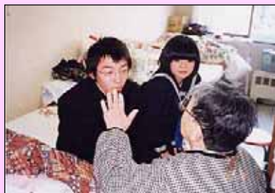
亀尾中学校の生徒さんと 話に花が咲く。