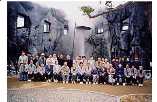
10月 C班旅行 鹿部温泉と間欠泉の旅(写真上)