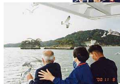
11月 A班旅行 会津若松と松島の旅 (写真右斜め3枚)