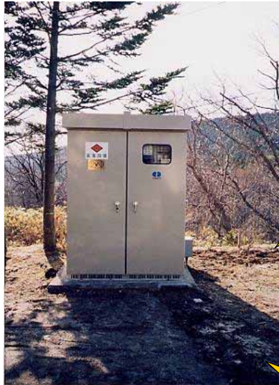
高圧受変電設備(写真上)

(写真右上より、電灯分電盤L-1、 L-2、L-3) (写真下左、動力分電盤) (写真下右、電灯分電盤内部)