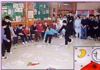
亀尾中学校生徒の皆さんと 「カルタ大会」