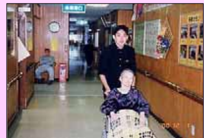
亀尾中学校の生徒さんと ～ちょっと、お散歩～