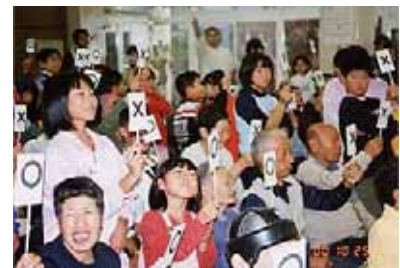
亀尾小学校児童の皆さんと 「O×ゲーム」を楽しむ入所者