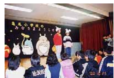
亀尾小学校児童の皆さんによる 劇・「ねずみのよめいり」