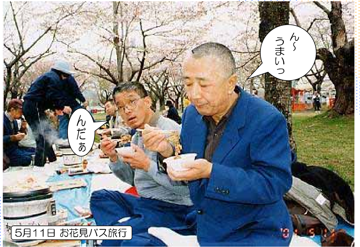
5月11日 お花見バス旅行