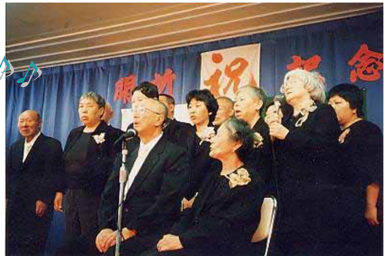
< 開所記念祝賀会で熱唱するクラブ員の皆さん >

ご寄贈頂きましたレーザーカラオケを駆使し、毎月第一・第三水曜日に男性5名・女性7名の12名で、歌っています。