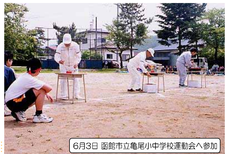
6月3日 函館市立亀尾小中学校運動会へ参加