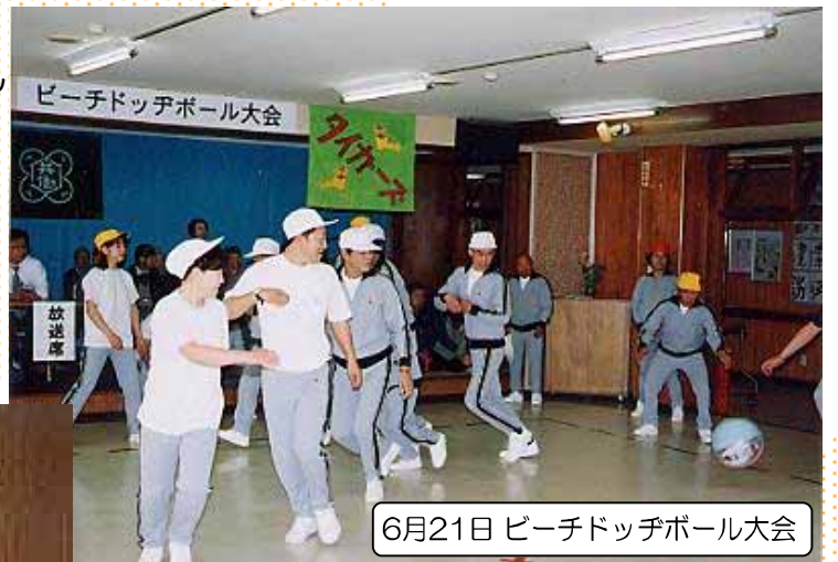
6月21日 ビーチドッチボール大会