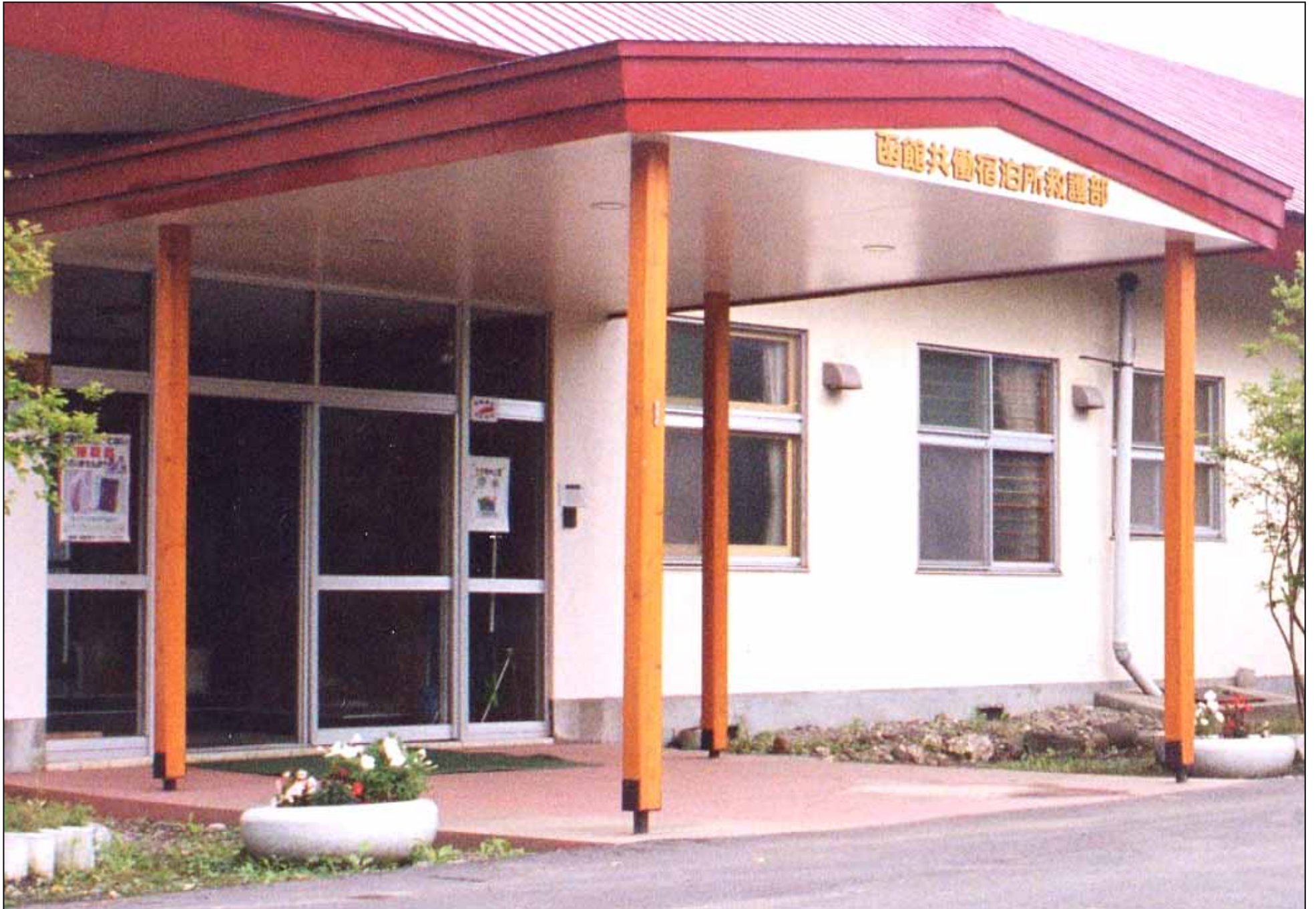
撮影場所／函館共働宿泊所救護部正面玄関