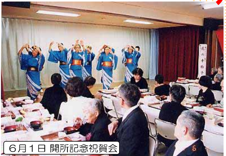
6月1日 開所記念祝賀会