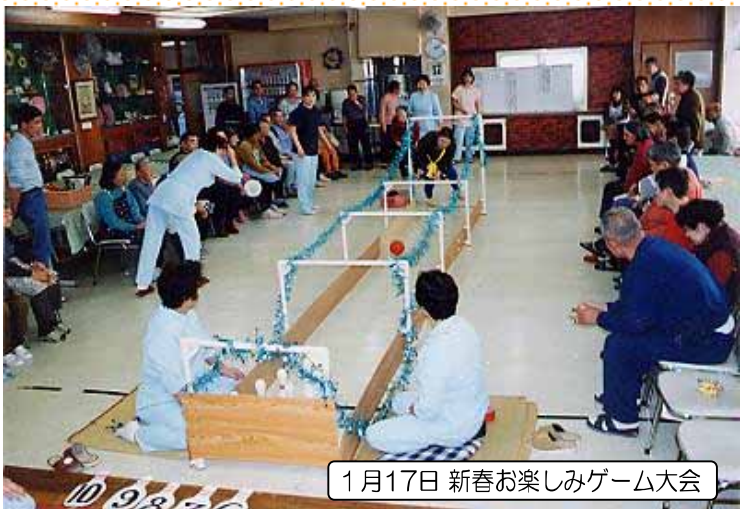
1月17日 新春お楽しみゲーム大会