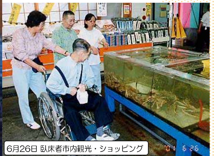
6月26日 臥床者市内観光・ショッピング