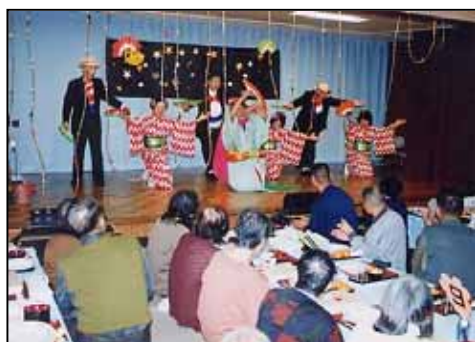
10月生まれ 「島田のブンブン」