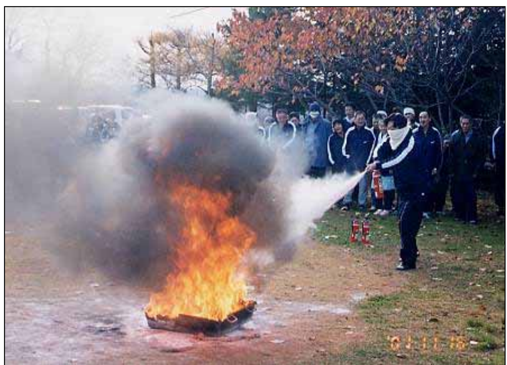
(粉末消火器による消火体験)