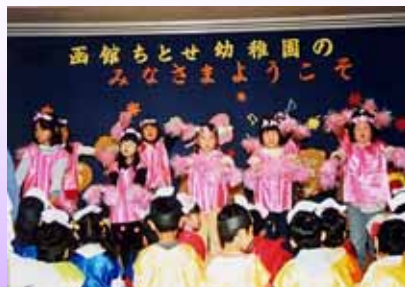
園児の皆さんによる合唱（写真上）と オペレッタ「サルカニ合戦」（写真左）