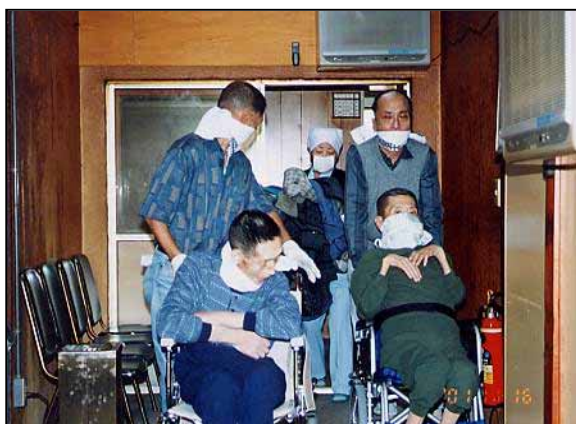
(避難誘導班担架組による避難誘導訓練)