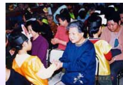
「焼きイモじゃんけん」（写真上） 「幸せなら手をたたこう」（写真下） に興じる、入所者と園児の皆さん