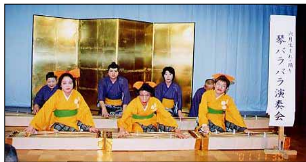
6月生まれ「琴バラバラ演奏会」