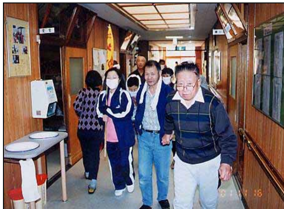
(避難誘導班徒歩組による避難誘導訓練)