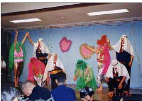
2月生まれ「桃色吐息」