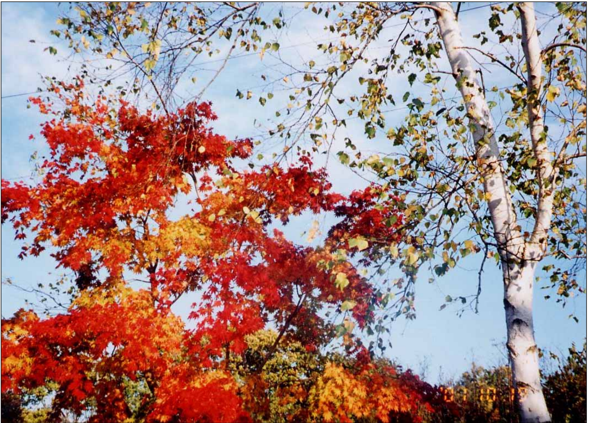
撮影場所／函館共働宿泊所救護部(正面玄関前庭)の紅葉と白樺