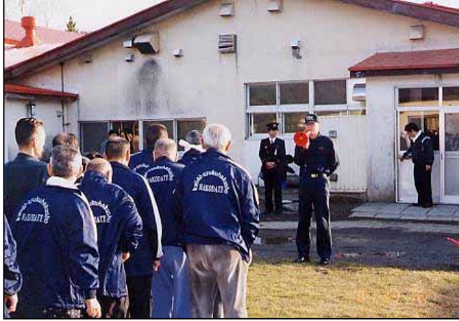
(消防署員の方々の避難訓練の総評を、真剣な面持ちで聞き入る利用者の皆さん)