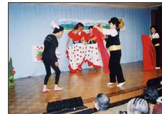
12月生まれ 「スペインの祭り」