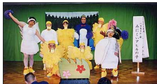
8月生まれ「みにくいアヒルの子」