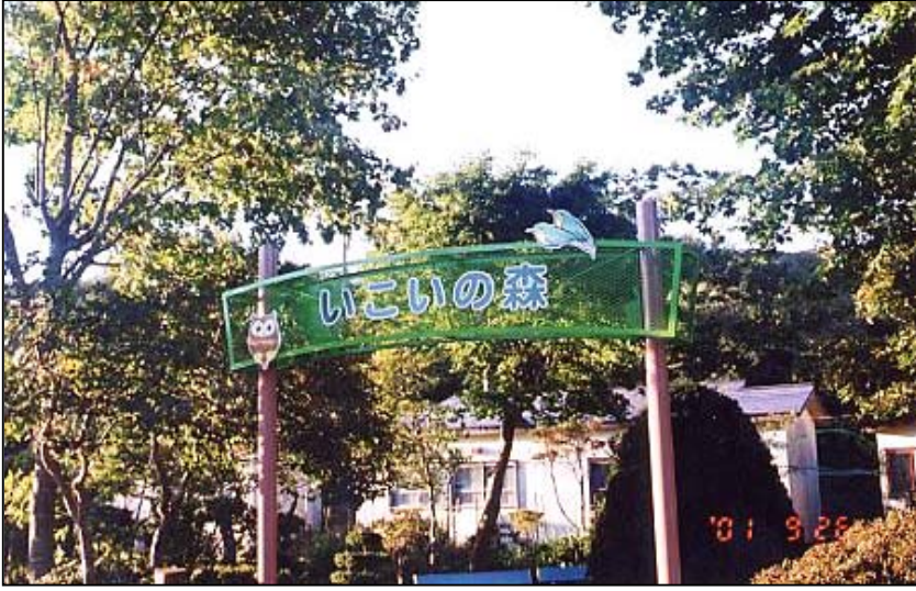
(「いこいの森」正面入り口ゲート)

此の度、当施設「園芸クラブ」の皆さんと、担当職員の正に人力によりまして、「いこいの森」が完成致しました。雪解けの4月から初秋の9月まで、毎週火曜日、延べ6カ月を費やしました。