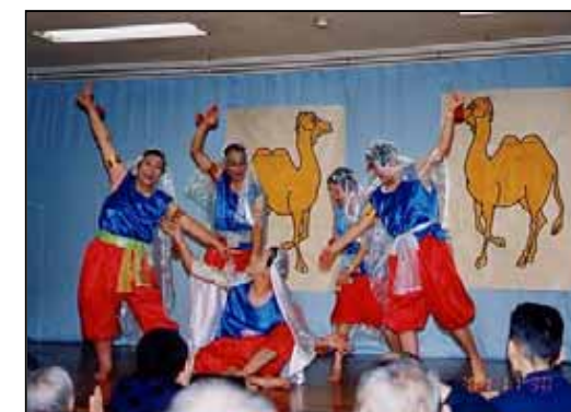
4月生まれ 「月夜のキャラバン」